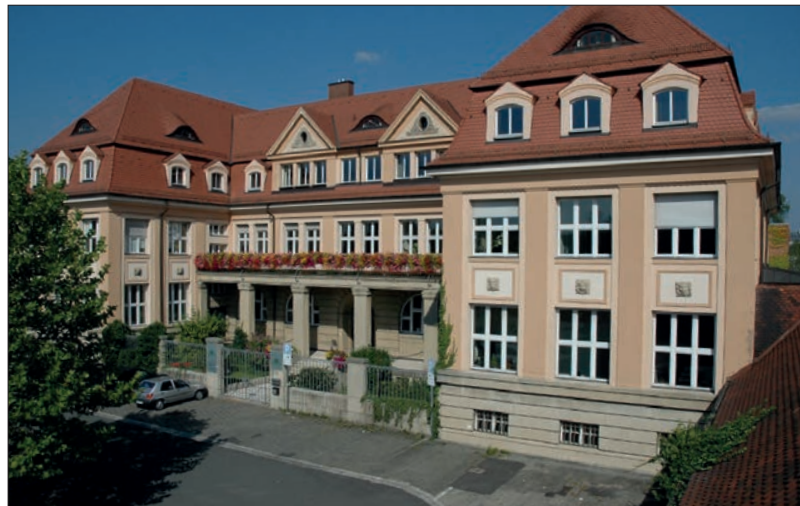
Bild 3 Der Firmensitz von Riedhammer in Nürnberg

sind gasdichte Rollen- oder Drehrohröfen in diesem Marktsegment weit verbreitet. Seit 2010 haben wir über 450 Öfen zur Herstellung von lithiumbasierten Batteriematerialien an unsere Kunden weltweit geliefert – sowohl Rollenöfen als auch Drehrohröfen.