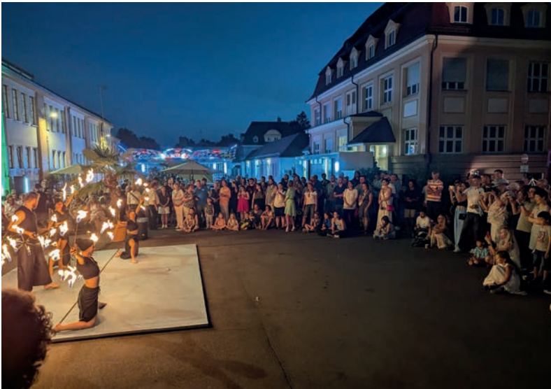
Bild 4 Impressionen von der Feuershow zum Firmenjubiläum