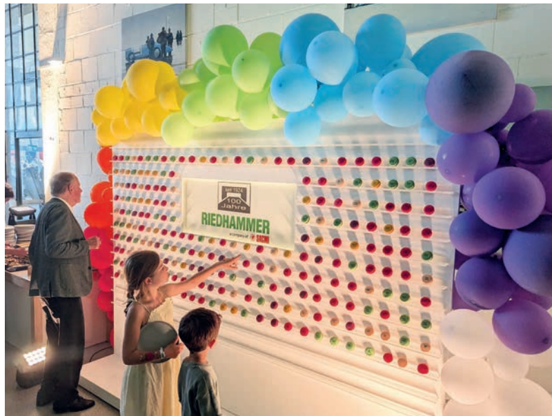
Bild 6 Auch für die kleinsten Firmenangehörigen wurde etwas geboten

Neben der Technikumsausstattung zur Entwicklung und Erprobung des Prozesses kann die SACMI-Gruppe auch die entsprechenden Produktionsanlagen herstellen und liefern. In enger Zusammenarbeit mit unseren Kunden erarbeiten wir so die Grundlagen für den späteren industriellen Prozess und setzen diesen in eine Produktionsanlage um.